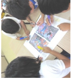
【写真フォトランゲージの様子】

4～5人のグループになって、「フォトランゲージ」を行った。一人ひとりにマジックを渡し、写真から気づいたことを何でもいいのでマジックで書いてみる。各グループの書いた内容を発表し合いながら、気がついたことを共有する。