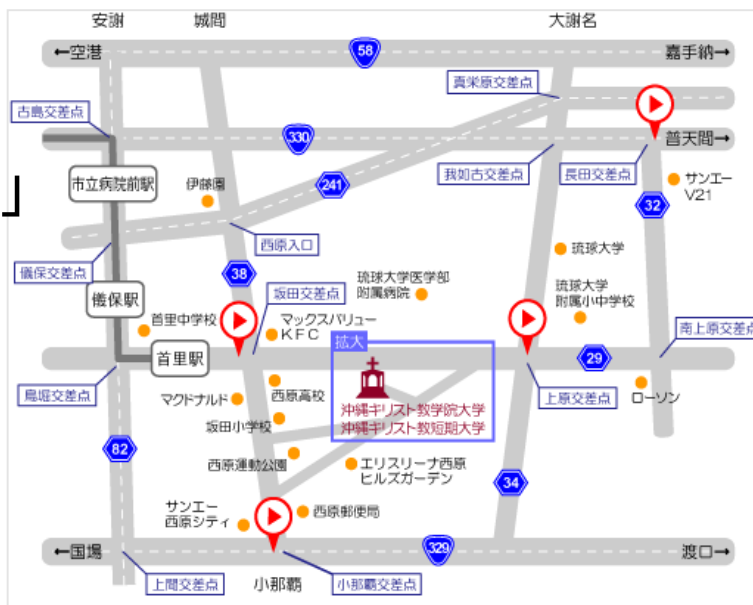
会場：沖縄キリスト教学院大学 西原町翁長777

NPO法人沖縄NGOセンター 〒901-2211 宜野湾市宜野湾3-23-52 TEL:098-892-4758 FAX:098-892-9908 Email:onc@oki-ngo.org