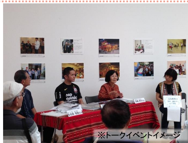
※トークイベントイメージ